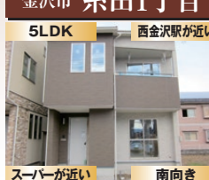
スーパーが近い 南向き