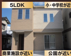
商業施設が近い 公園が近い