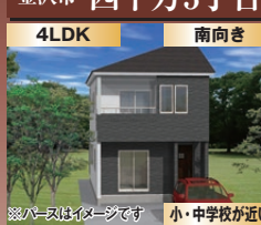
小・中学校が近い