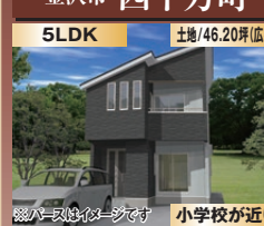
小・中学校が近い