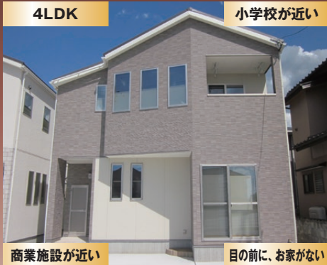
商業施設が近い 目の前に、お家がない

月々57,108円 ※返済例は、2,200万円借入、金利0.5% 2年固定(35年返済)の場合です。