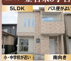
小・中学校が近い 南向き