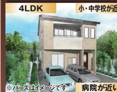
商業施設が近い 病院が近い