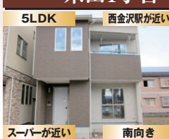
スーパーが近い 南向き