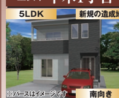
バスはイメージです 南向き