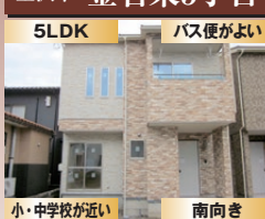
小・中学校が近い 南向き