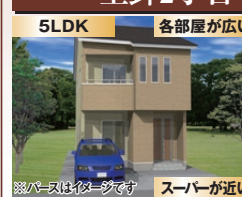
バスはイメージです スーパーが近い