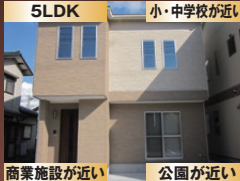
商業施設が近い 公園が近い