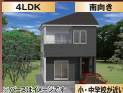
バスはイメージです 小・中学校が近い