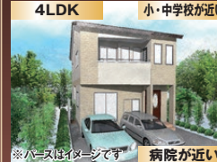
バスはイメージです 病院が近い