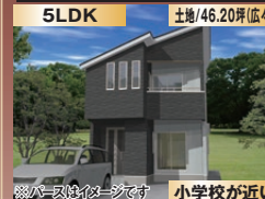
バスはイメージです 小学校が近い