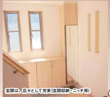
玄関は、広々として充実(玄関収納・ニッチ等)