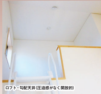
ロフト・勾配天井(圧迫感がなく開放的)