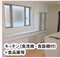
キッチン(食洗機・食器棚付)+食品庫等