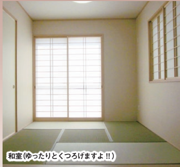
和室(ゆったりとくつろげます!!)