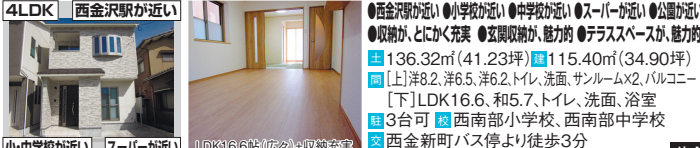
小・中学校が近い スーパーが近い LDK18.6帖(広々)+収納充実

●西金沢駅が近い ●小学校が近い ●中学校が近い ●スーパーが近い ●公園が近い ●収納が、とにかく充実 ●玄関収納が、魅力的 ●テラススペースが、魅力的