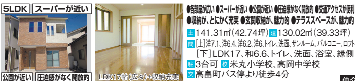
公園が近い 圧迫感がなく開放的 LDK17帖(広々)+収納充実

●各部屋が広い ●スーパーが近い ●公園が近い ●圧迫感がなく開放的 ●交通アクセスが便利 ●収納が、とにかく充実 ●玄関収納が、魅力的 ●テラススペースが、魅力的