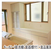
キッチン・食洗機・食器棚付・食品庫等