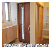
玄関・食器棚・収納庫(シューズ)