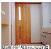
収納庫(食器棚付)・玄関収納(シューズ)