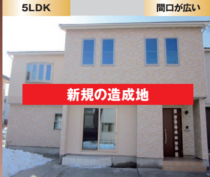
小・中学校が近い スーパーが近い