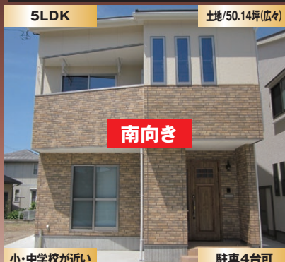
小・中学校が近い 駐車4台可