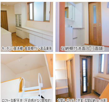
キッチン横洗剤・食器棚付/食品庫等